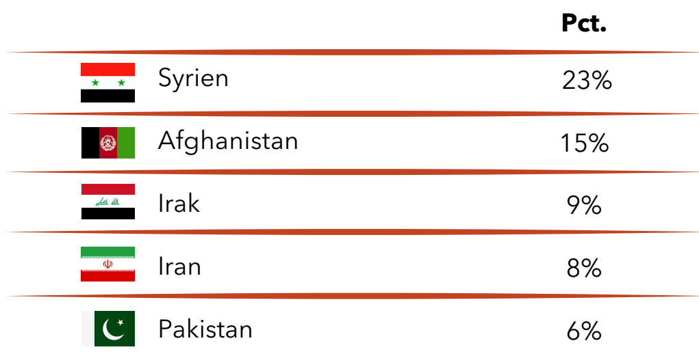
Figur 2. De fem hyppige fødelande for deltagerne i perioden 1.1.2022-15.6.2023