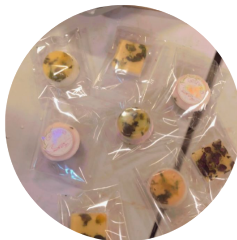
Foto: Unge fra Smedetoften. Sæber lavet i forbindelse med N'Vest.

Også andre steder er der indikationer på, at der kan skabes en højere grad af synergi på Smedetoften. De unge benytter sig af aktiviteterne på forskellig vis, og mens nogle bruger et bredt udvalg af tilbud,