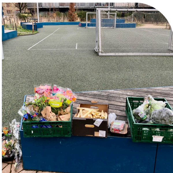
Nordvest Fællesskabets maduddeling på torvet.

for, hvordan samfundet er sammensat. De mange aktører, der benytter Smedetoftens faciliteter og rammer er ligeledes med til at sætte dagsordenen på stedet og bliver dermed normskabende for, hvilken social adfærd, der er acceptabel. Disse møder og perspektiver giver en baggrundsforståelse, som kan være demokratisk dannende og "en øvebane for at møde samfundet", som en ansat formulerer det.